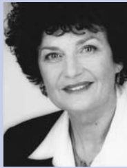
Profesora Fiona Stanley, AC

La patrona y oradora principal Australiana para la apertura del XXIV Congreso Mundial de la OMEP 2004 es la Australiana del Año 2003, Profesora Fiona Stanley. Aclamada internacionalmente por su trabajo en investigación de la salud infantil, el objetivo profesional de la Profesora Stanley es de asegurar un compromiso por parte de Australia para mejorar significativamente el bienestar de los niños y los jóvenes. La Profesora Stanley es la directora y fundadora del Instituto de Telethon para la Investigación de la Salud Infantil, una entidad para la investigación multidisciplinaria la cual investiga las causas y prevenciones de las mayores enfermedades y discapacidades infantiles. Ella es la primera CEO de la Alianza de Investigación Australiana para Niños y Jóvenes, una organización nacional de investigadores, profesionales y elaboradores de políticas establecidas para mejorar la salud de la juventud Australiana.