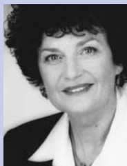
Professeur Fiona Stanley, AC

La Marraine et principale oratrice australienne pour l'inauguration du XXIV ème Congrès de l'OMEP 2004 est l'Australienne de l'année 2003, le Professeur Fiona Stanley. Reconnue internationalement pour ses travaux de recherche sur la santé des enfants, le Professeur Stanley s'est fixé pour but professionnel d'obtenir l'engagement de l'Australie à améliorer considérablement la santé et le bien-être des enfants et des jeunes gens.